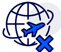
Følg reise- og aktivitetsråd fra myndighetene.