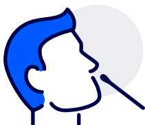
Test deg ved mistanke. Hold deg hjemme hvis du har symptomer.