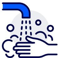
Vask hendene ofte og grundig, og bruk antibac.