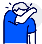
Ha god hoste- og nysehigiene. Bruk armkroken!